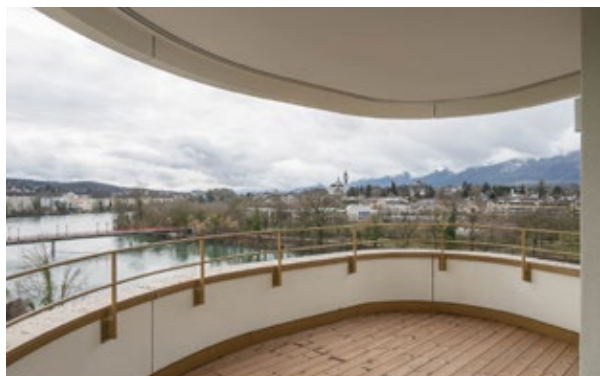
Vue depuis le balcon sur l'Aar et la vieille ville de Soleure