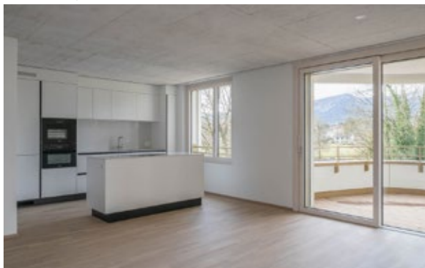
Cuisine haut de gamme