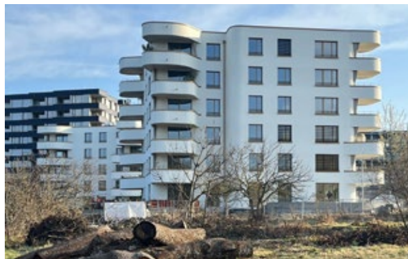
Situés directement au bord de l'Aar, les bâtiments résidentiels constituent l'identité du quartier