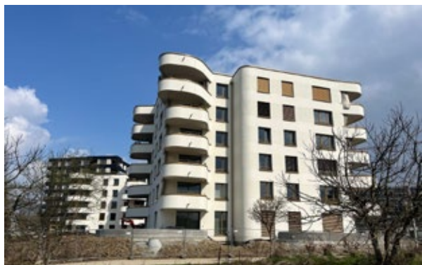
Vue extérieure des bâtiments résidentiels B2 et B3

Les locataires ont emménagé comme prévu, en mars 2026. L'achèvement et la livraison des bâtiments B2 et B3 permettront de passer à la phase d'exploitation, contribuant ainsi de manière substantielle à la création de valeur et au développement qualitatif du site.